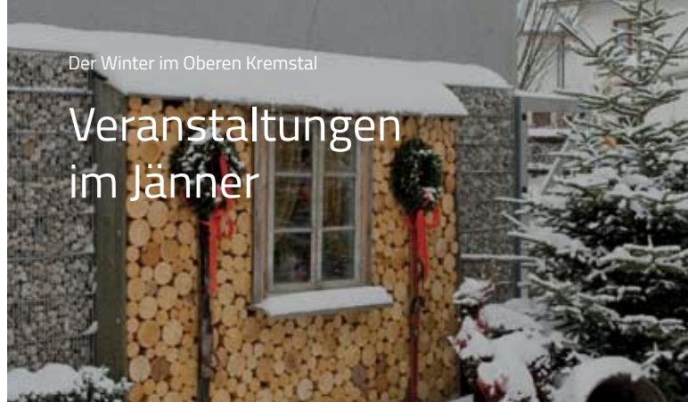
Der Winter im Oberen Kremstal

Sonntag, 31. Dezember Kirchdorf, Straubinger M.A.D.ness Disc, 22:00 Uhr Silvester mit DJ Fredi , +43 7582 64577